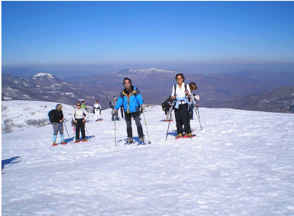
Escursione con racchette da neve 2009