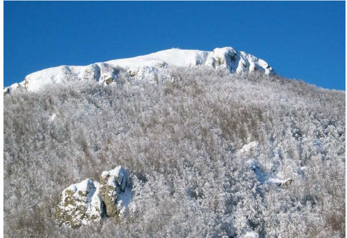
Il Monte Maggiorasca svetta dai boschi innevati

Il luogo: La Val d'Aveto è certamente la zona più alpestre del nostro entroterra. Imponenti montagne fanno da cornice a fitti boschi di faggi e popolamenti di abeti . D'inverno la neve cade abbondante addolcendo il paesaggio e contribuendo a preservare la vita del bosco dal gelo invernale.